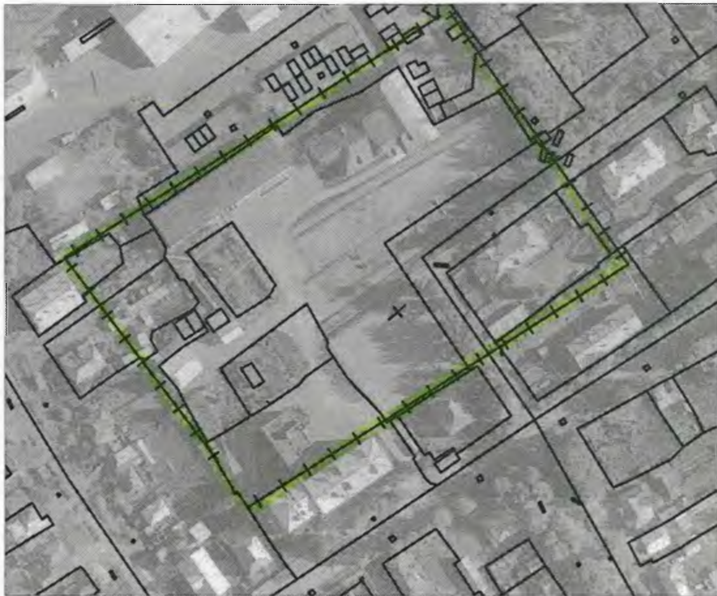
Схема границ прилегающих к объекту, расположенному по адресу: г.Боготол, ул. Деповская, д. 3, территорий на которых не допускается розничная продажа алкогольной продукции