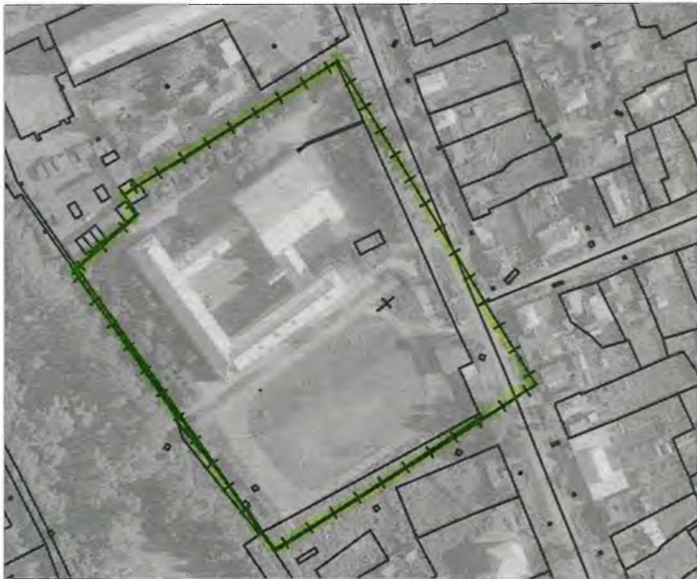
Схема границ прилегающих к объекту, расположенному по адресу: г.Боготол, ул. Куйбышева, д. 43, территорий на которых не допускается розничная продажа алкогольной продукции