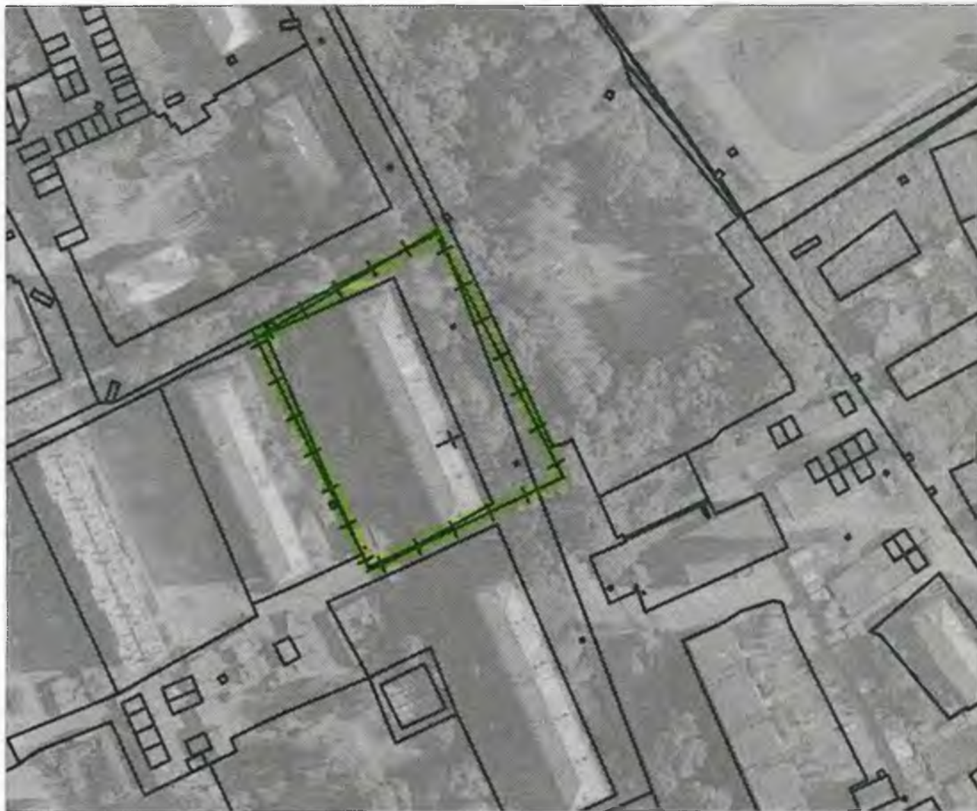
Схема границ прилегающих к объекту, расположенному по адресу: г.Боготол, ул.Комсомольская, д. 16, территорий на которых не допускается розничная продажа алкогольной продукции