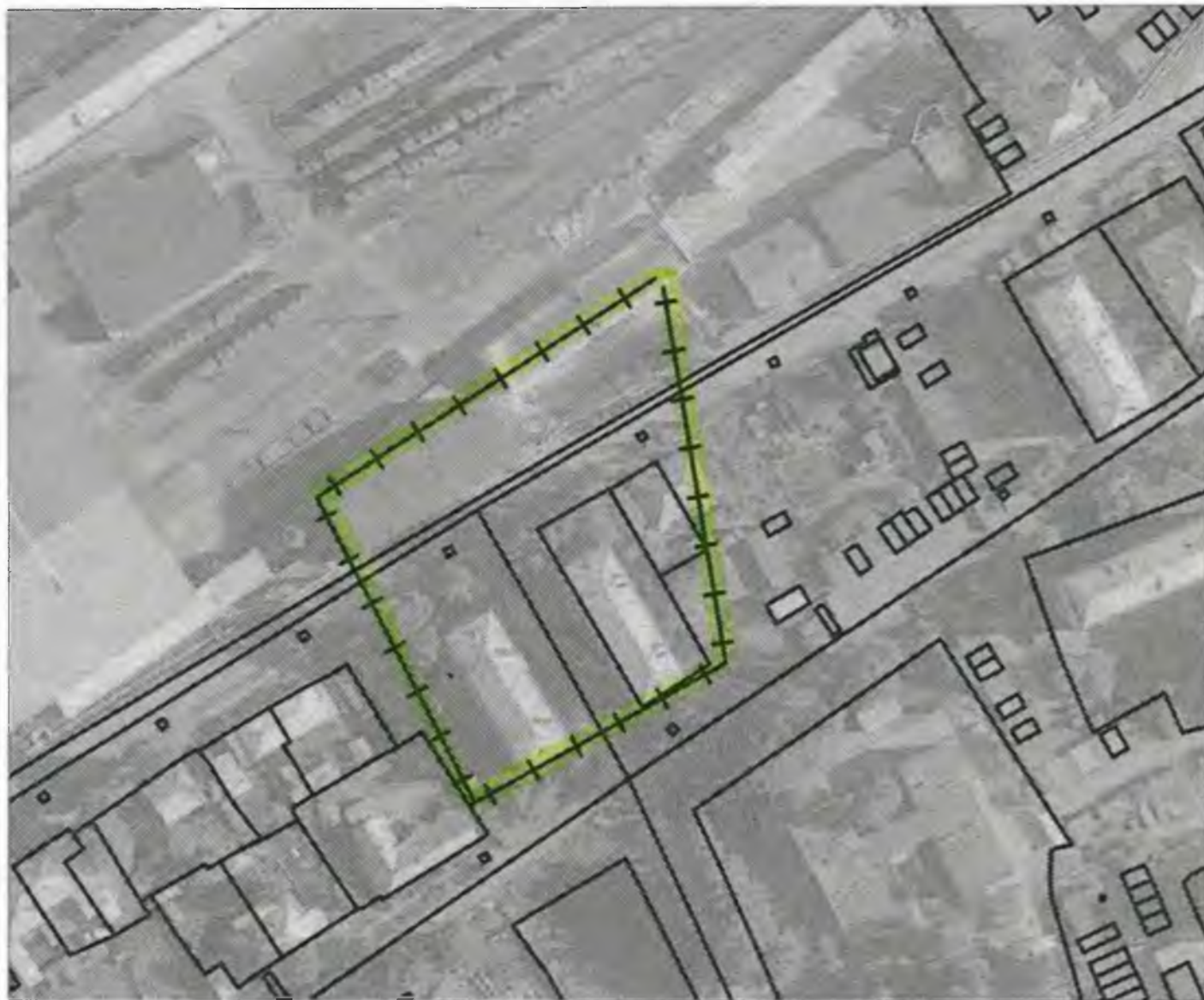
Схема границ прилегающих к объекту, расположенному по адресу: г.Боготол, ул.Деповская, д. 34, территорий на которых не допускается розничная продажа алкогольной продукции