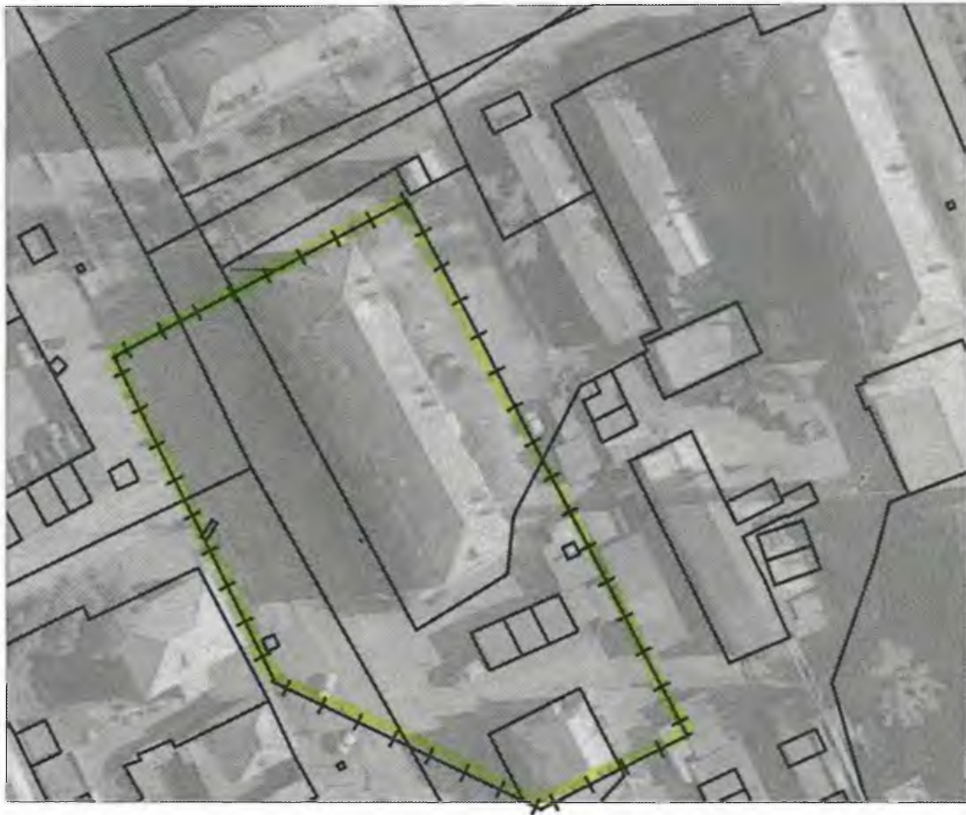
Схема границ прилегающих к объекту, расположенному по адресу: г.Боготол, ул.Советская, д. 13, территорий на которых не допускается розничная продажа алкогольной продукции