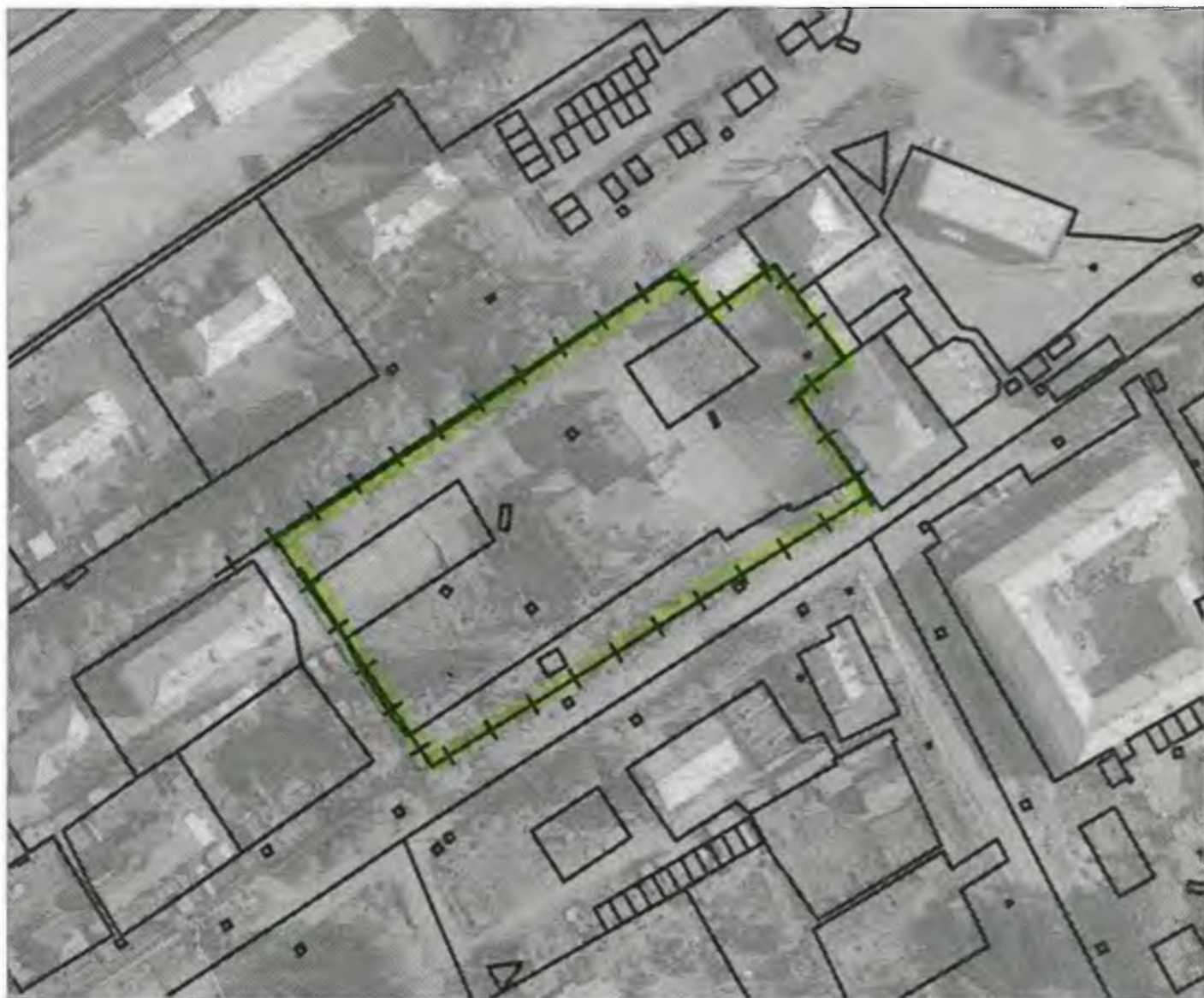
Схема границ прилегающих к объекту, расположенному по адресу: г.Боготол, ул.Деповская, д. 17, территорий на которых не допускается розничная продажа алкогольной продукции