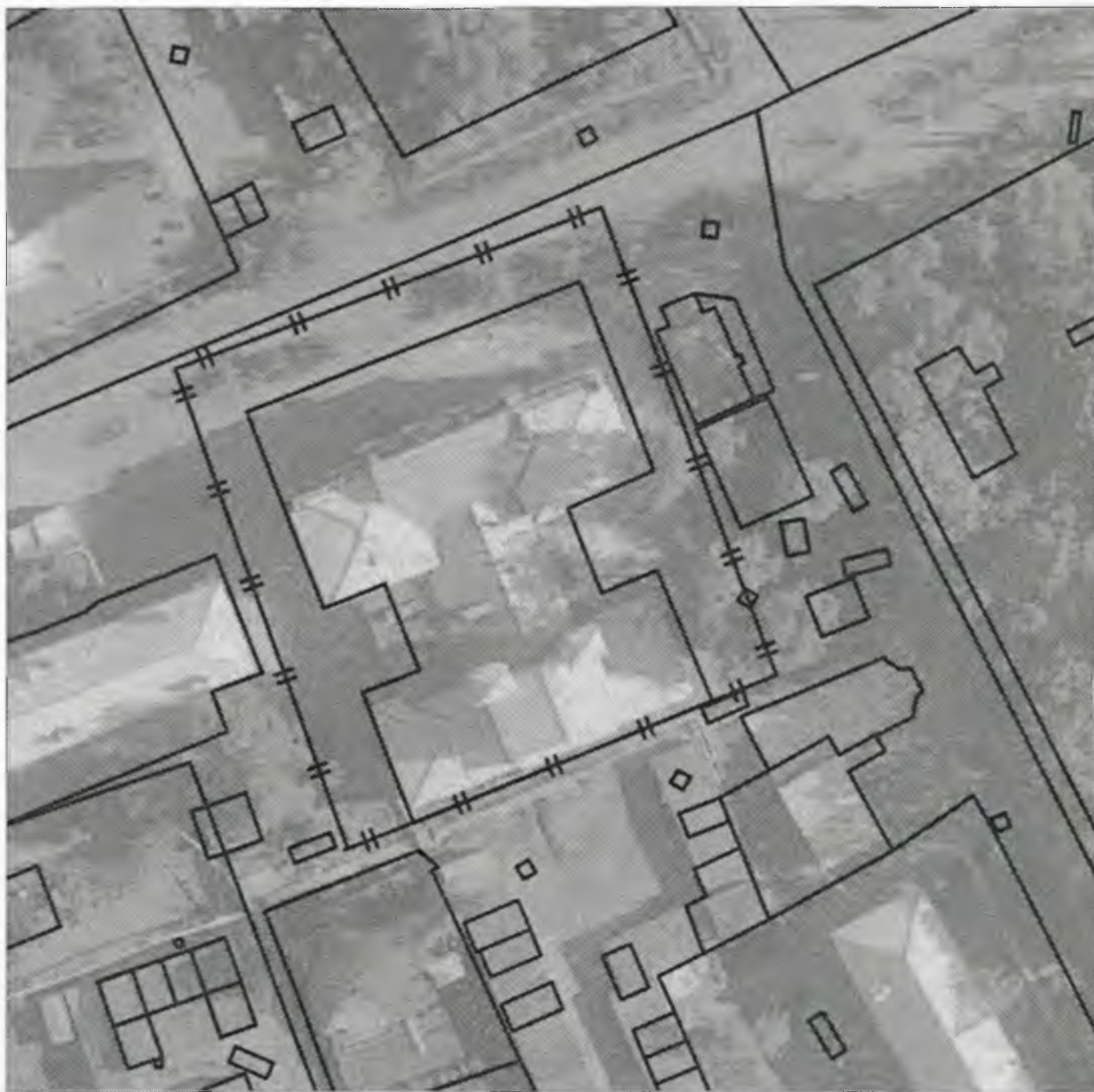
Схема границ прилегающих к объекту, расположенному по адресу: г. Боготол, ул. 40 лет Октября, д. 12, территорий, на которых запрещена розничная продажа алкогольной продукции