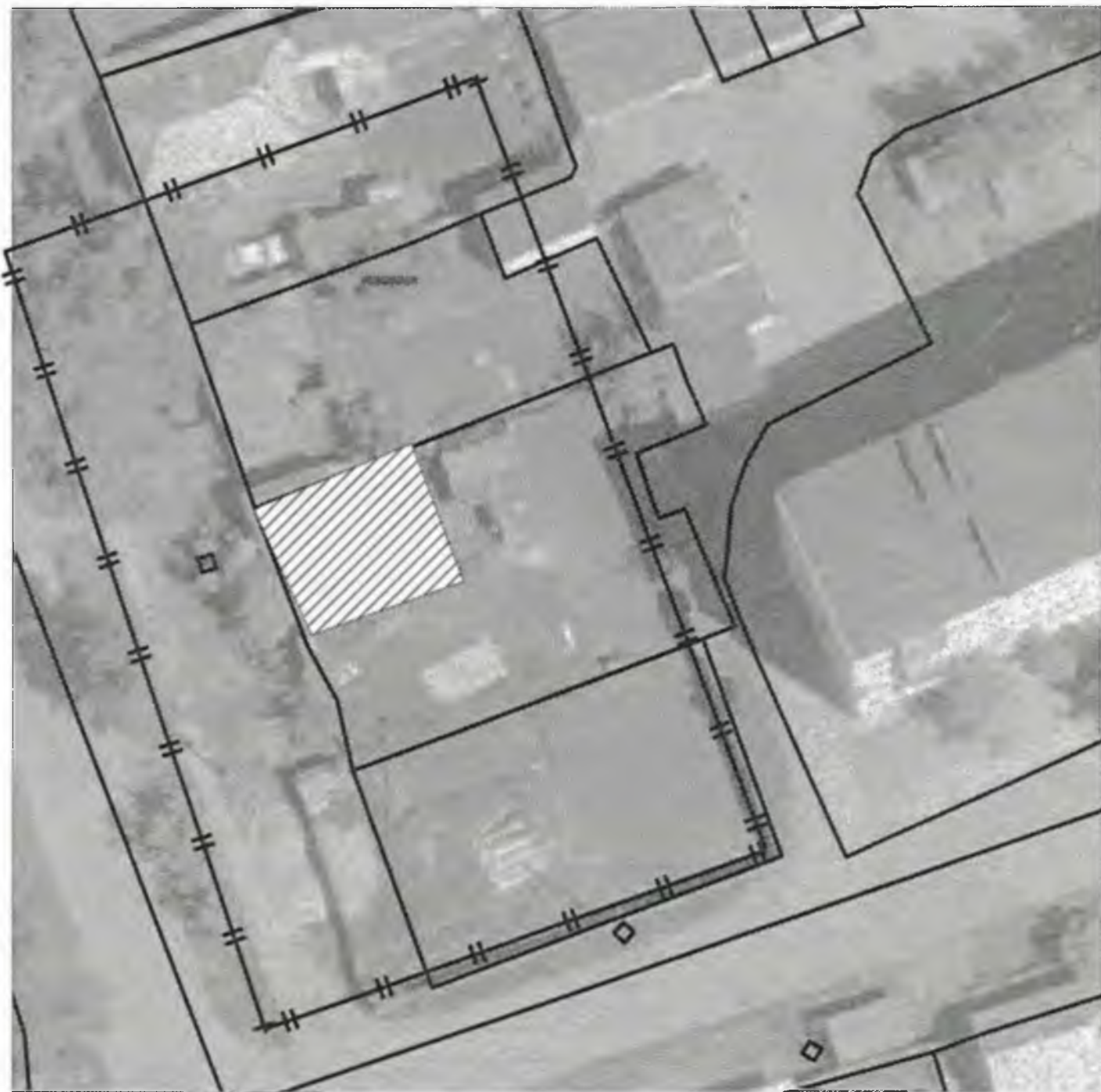
Схема границ прилегающих к объекту, расположенному по адресу: г.Боготол, ул. Советская, 77, территорий, на которых запрещена розничная продажа алкогольной продукции