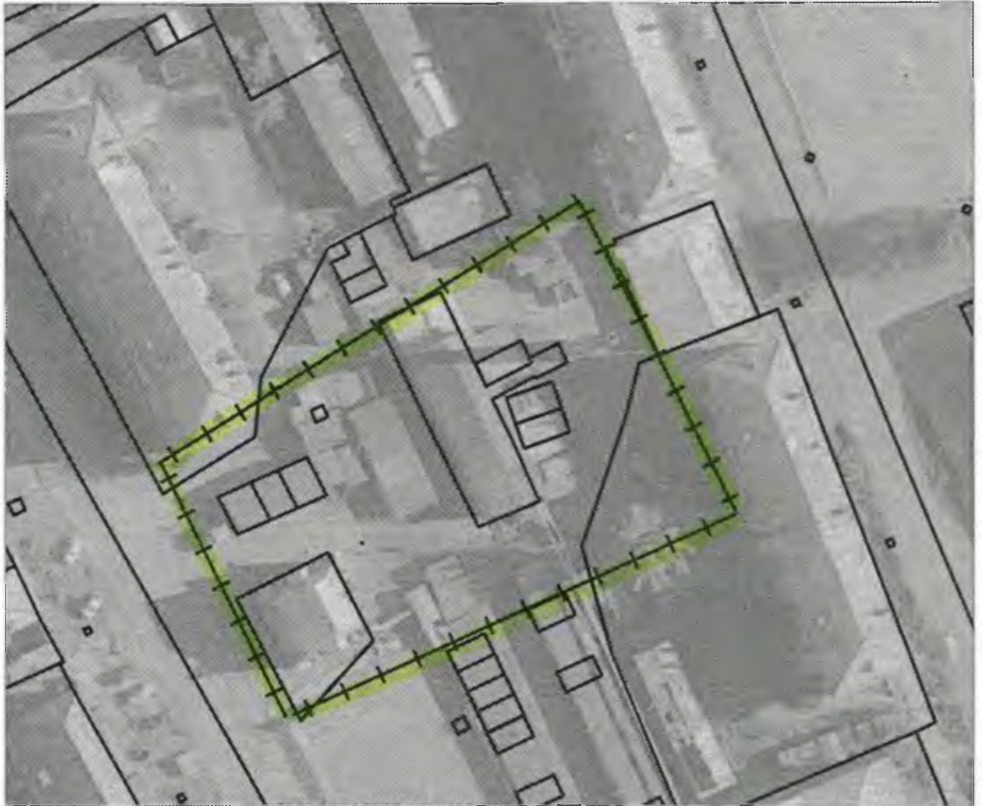
Схема границ прилегающих к объекту, расположенному по адресу: г.Боготол, ул.Советская, д. 15Б, территорий на которых не допускается розничная продажа алкогольной продукции