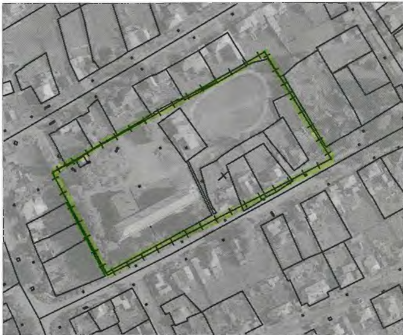
Схема границ прилегающих к объекту, расположенному по адресу: г.Боготол, ул. Северная, д. 9, территорий на которых не допускается розничная продажа алкогольной продукции