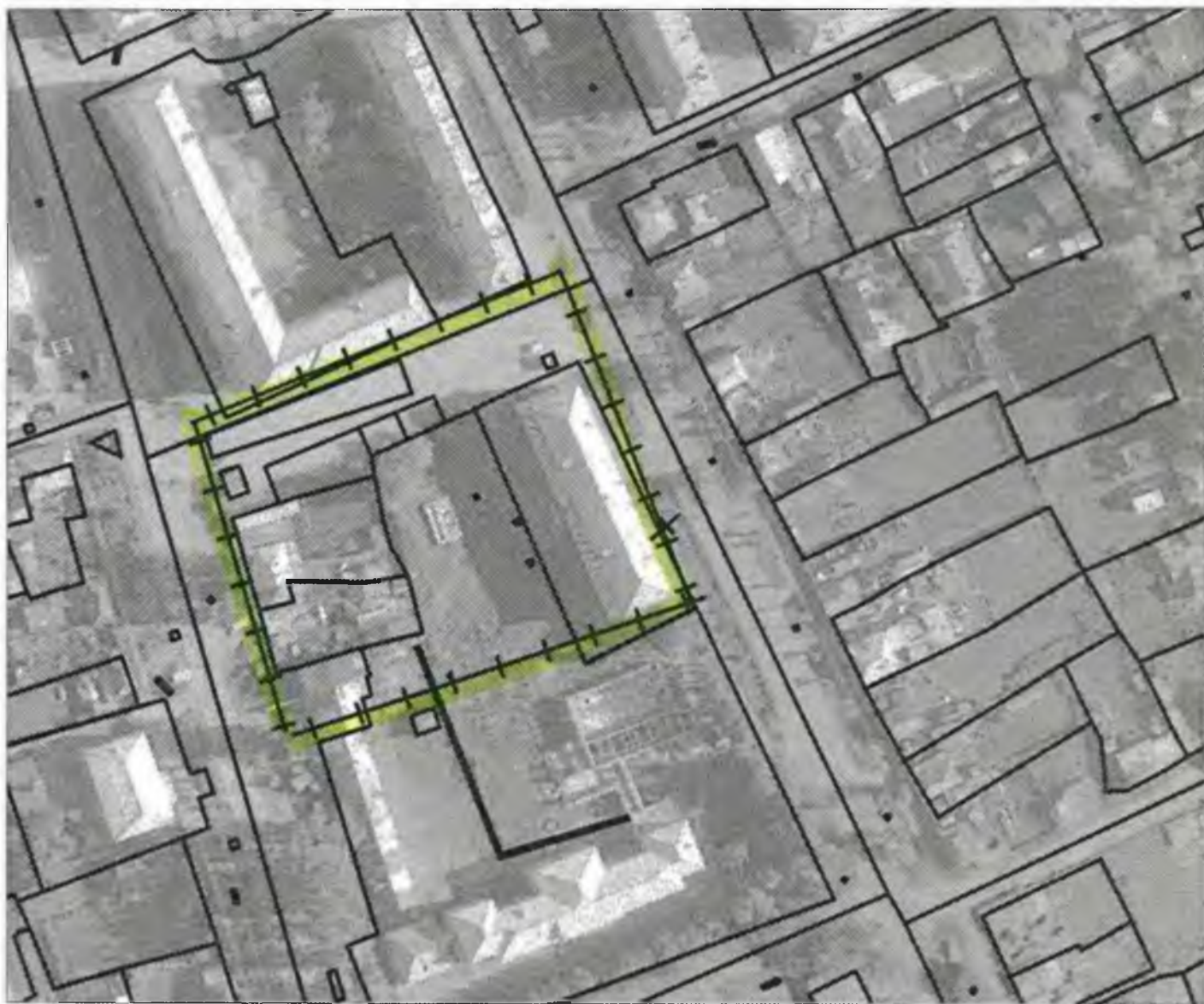
Схема границ прилегающих к объекту, расположенному по адресу: г.Боготол, ул. Кирова, д. 18, территорий на которых не допускается розничная продажа алкогольной продукции