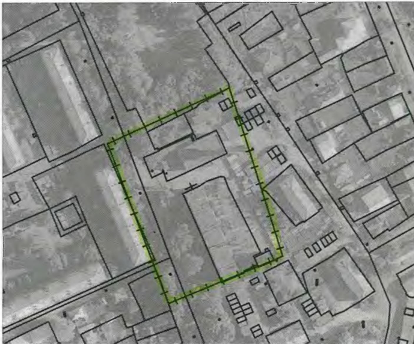
Схема границ прилегающих к объекту, расположенному по адресу: г.Боготол, ул.Комсомольская, д. 28, территорий на которых не допускается розничная продажа алкогольной продукции