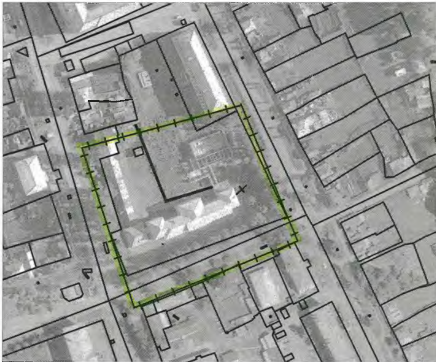
Схема границ прилегающих к объекту, расположенному по адресу: г.Боготол, ул. Школьная, д. 70, территорий на которых не допускается розничная продажа алкогольной продукции