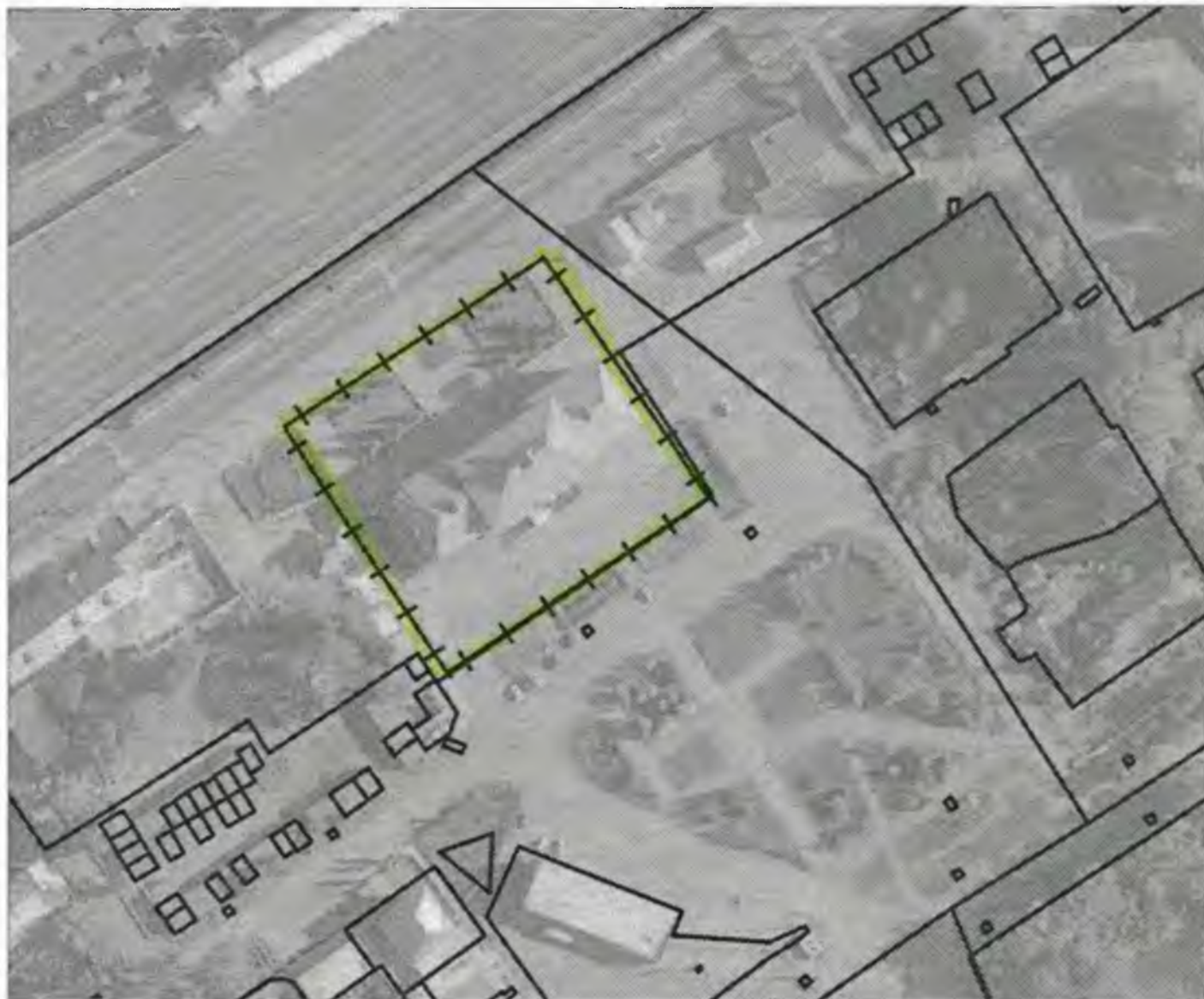
Схема границ прилегающих к объекту, расположенному по адресу: г.Боготол, ул.Вокзальная, д. 6, территорий на которых не допускается розничная продажа алкогольной продукции