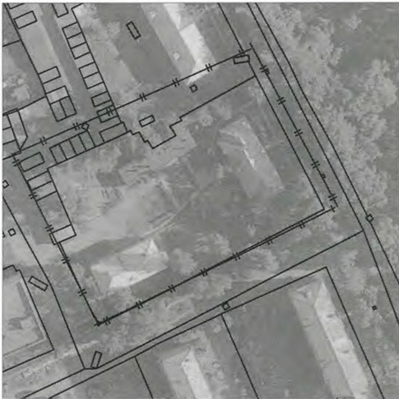
Схема границ прилегающих к объекту, расположенному по адресу: г.Боготол, ул. Комсомольская, д. 14, территорий, на которых запрещена розничная продажа алкогольной продукции

— || — || — † зона ограничений на которой не допускается розничная продажа алкогольной продукции