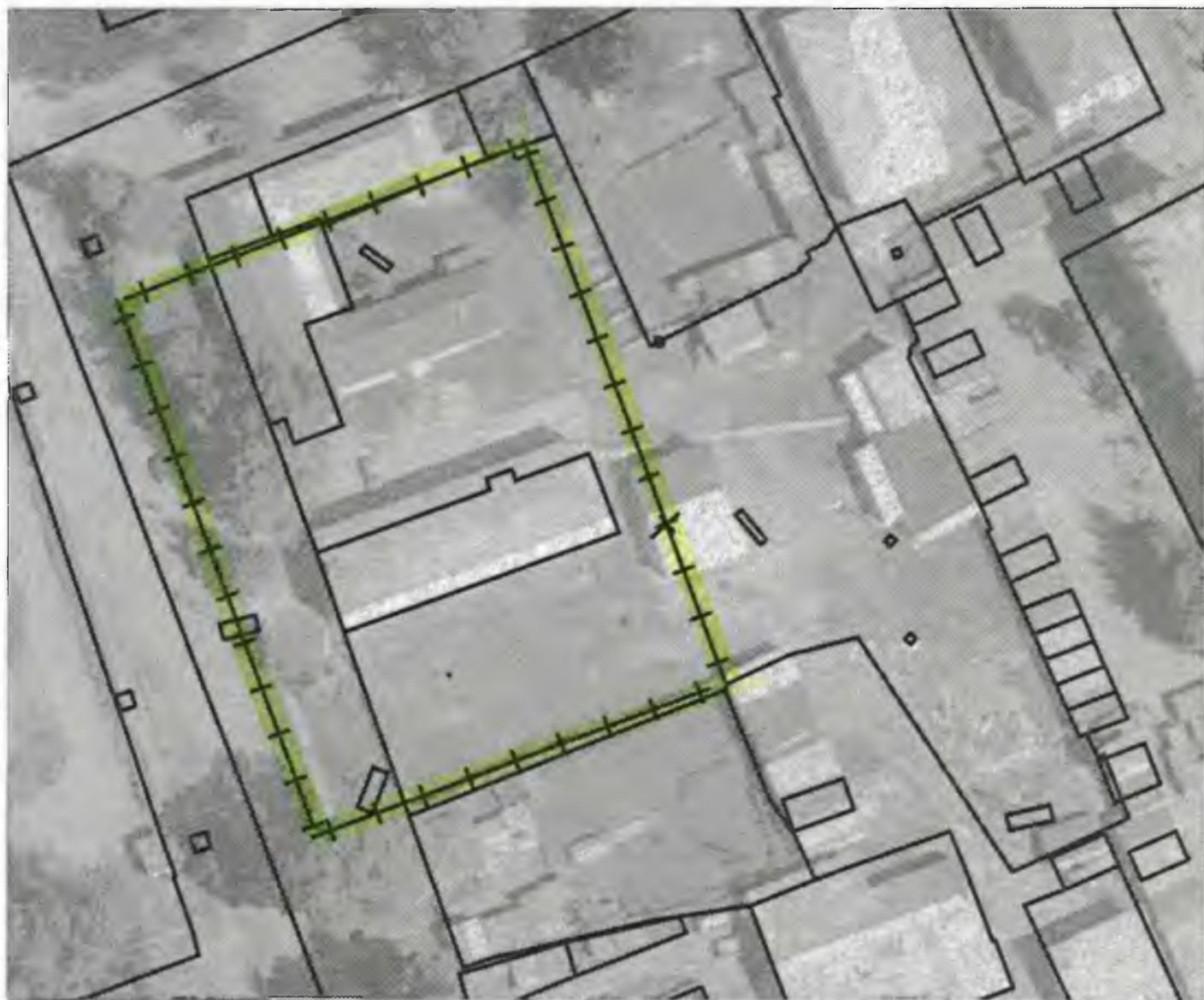
Схема границ прилегающих к объекту, расположенному по адресу: г.Боготол, ул. Советская, д. 63, территорий на которых не допускается розничная продажа алкогольной продукции