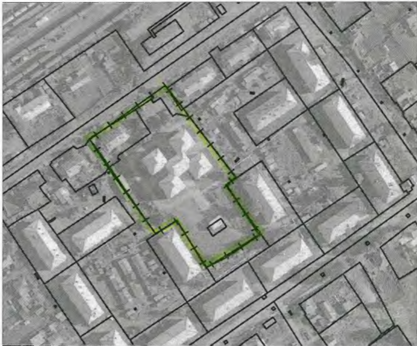
Схема границ прилегающих к объекту, расположенному по адресу: г.Боготол, ул. Сибирская, д. 34Б, территорий на которых не допускается розничная продажа алкогольной продукции