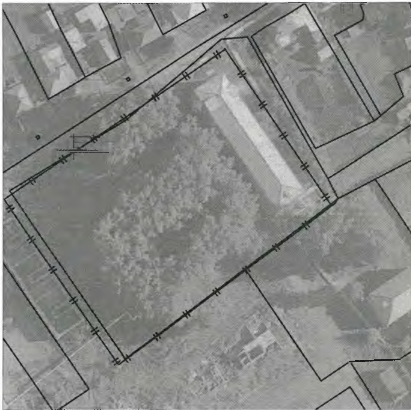
Схема границ прилегающих к объекту, расположенному по адресу: г.Боготол, ул. Больничная, 6А, территорий, на которых запрещена розничная продажа алкогольной продукции