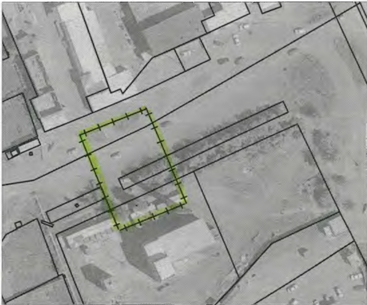
Схема границ прилегающих к объекту, расположенному по адресу: г.Боготол, ул.Молодежная, д. 23А, территорий на которых не допускается розничная продажа алкогольной продукции