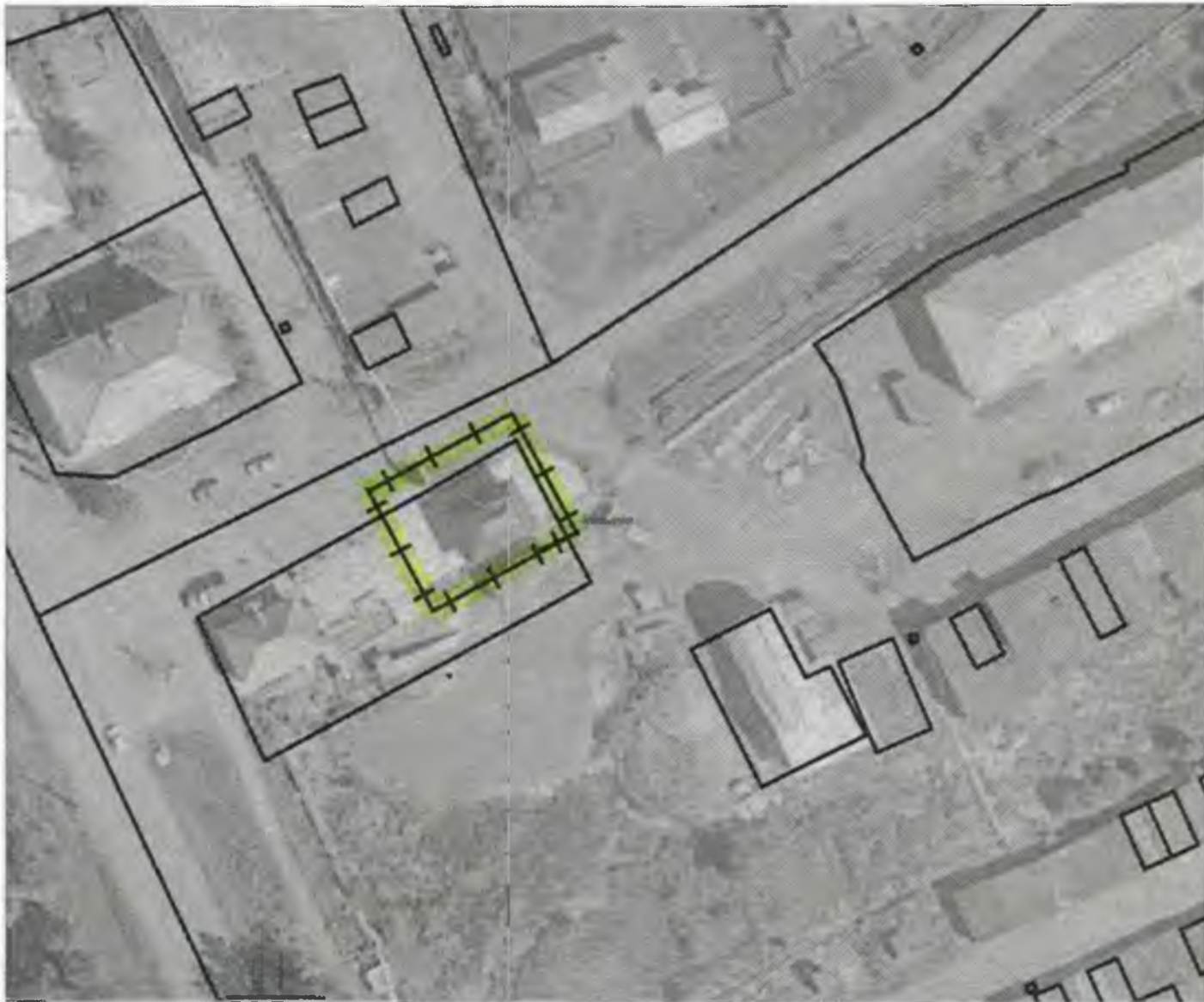
Схема границ прилегающих к объекту, расположенному по адресу: г.Боготол, ул.Совхозная, д. 2Б, территорий на которых не допускается розничная продажа алкогольной продукции