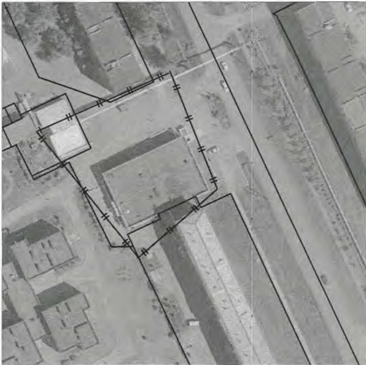
Схема границ прилегающих к объекту, расположенному по адресу: г.Боготол, ул. Кирова, 78, территорий. на которых запрещена розничная продажа алкогольной продукции