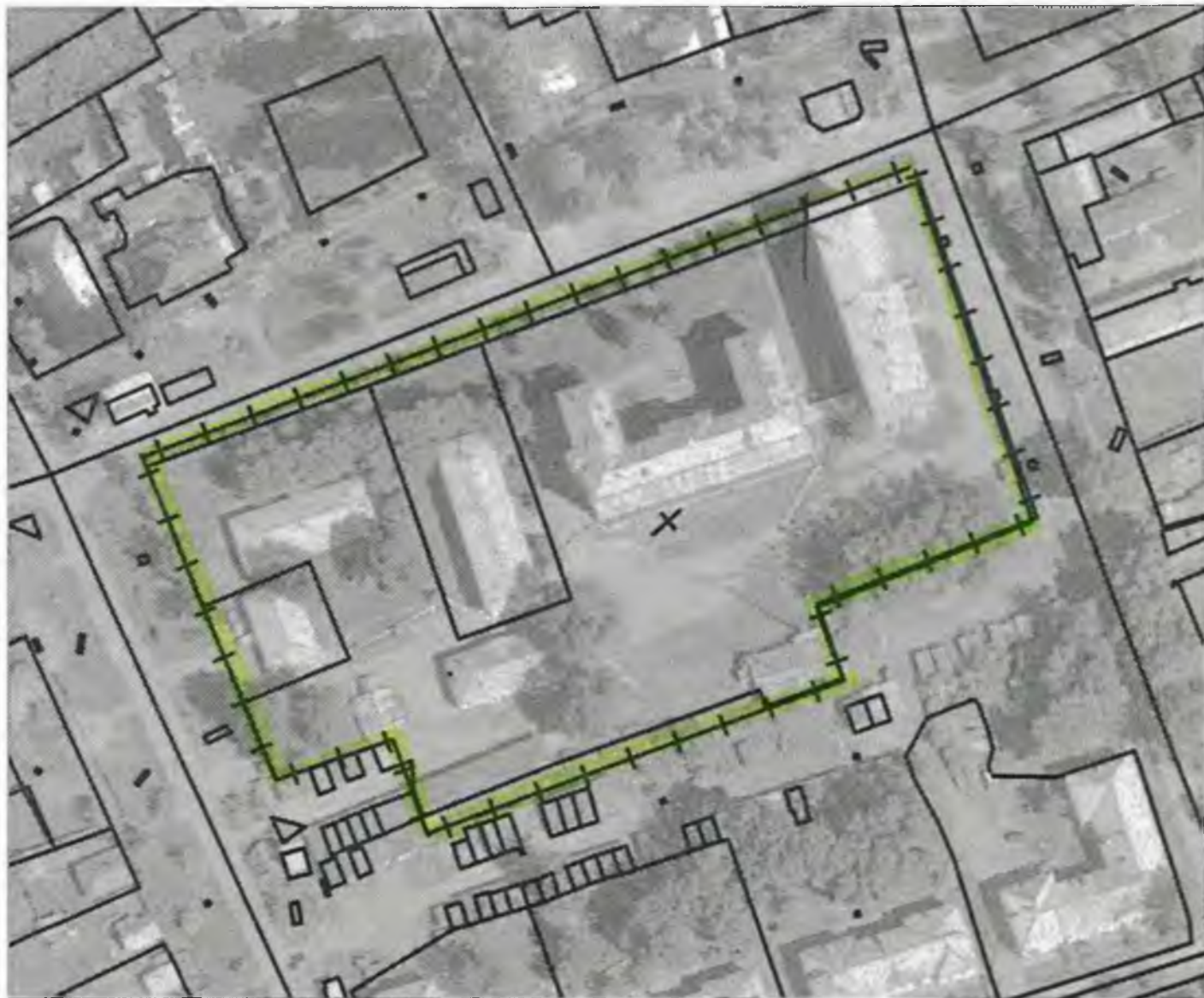
Схема границ прилегающих к объекту, расположенному по адресу: г.Боготол, ул. Школьная, 73, территорий на которых не допускается розничная продажа алкогольной продукции