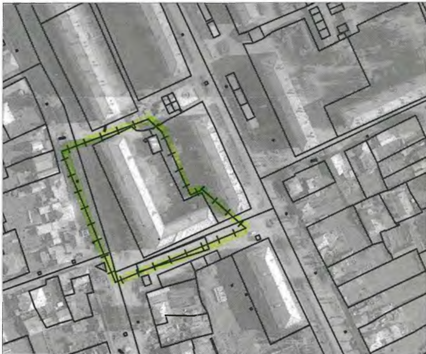
Схема границ прилегающих к объекту, расположенному по адресу: г.Боготол, ул.Советская, 19, территорий на которых не допускается розничная продажа алкогольной продукции