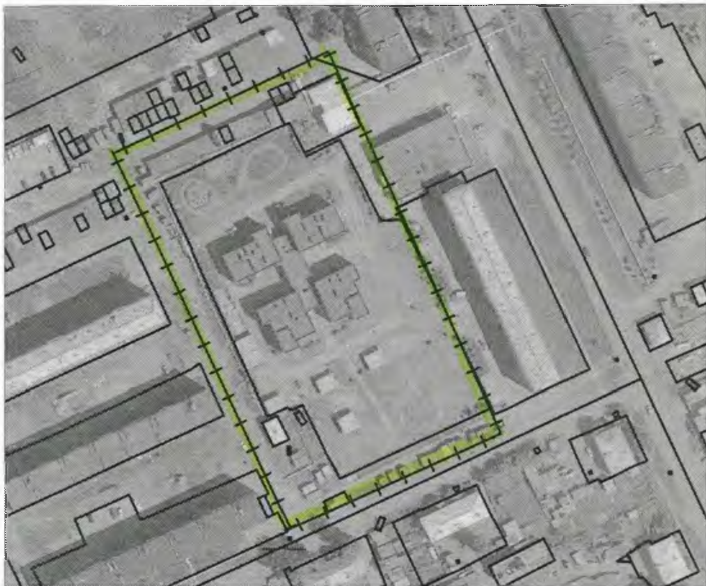
Схема границ прилегающих к объекту, расположенному по адресу: г.Боготол, ул. Ефремова, д. 2А, территорий на которых не допускается розничная продажа алкогольной продукции