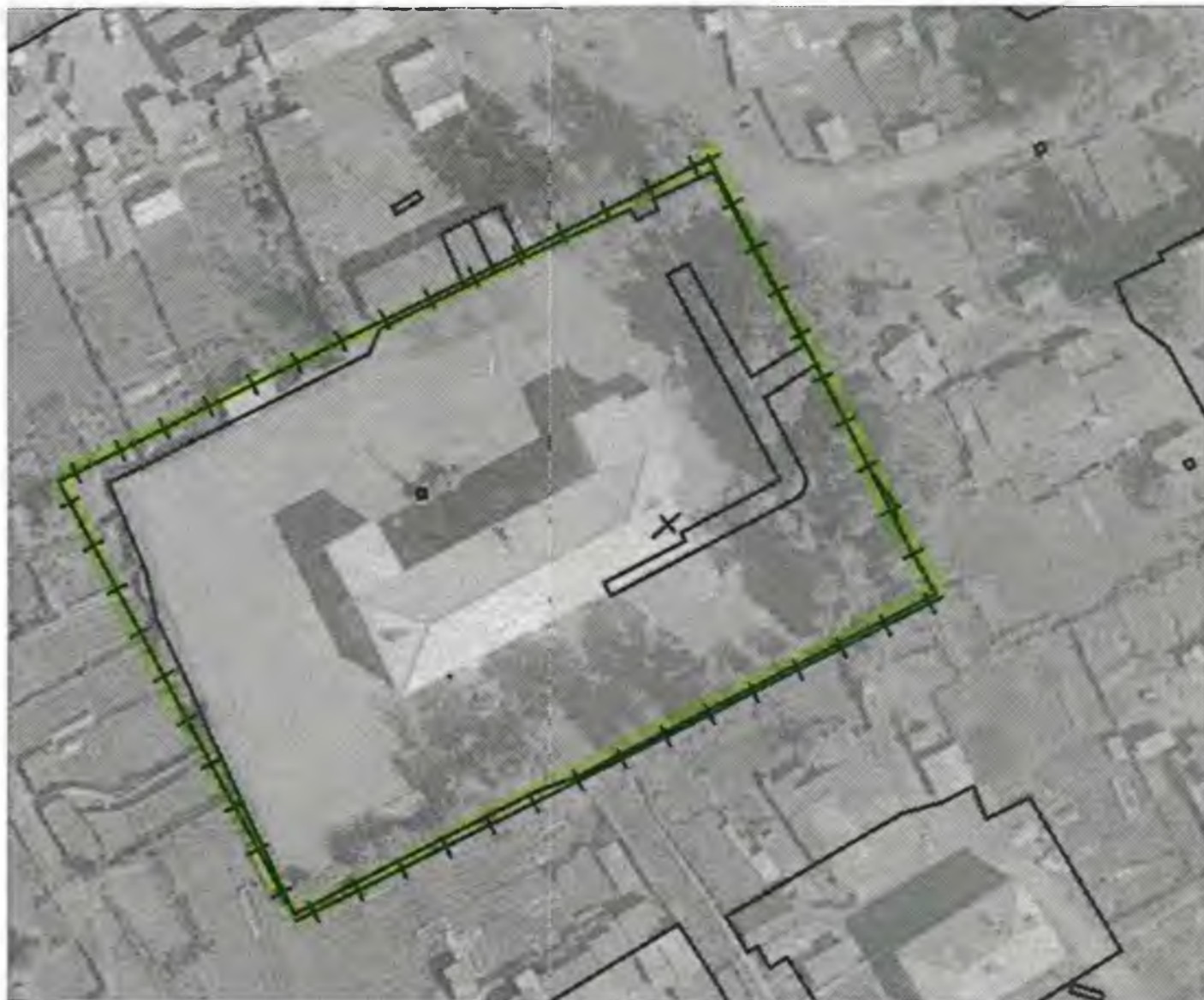
Схема границ прилегающих к объекту, расположенному по адресу: г.Боготол, ул. Промышленная, д. 6А, территорий на которых не допускается розничная продажа алкогольной продукции