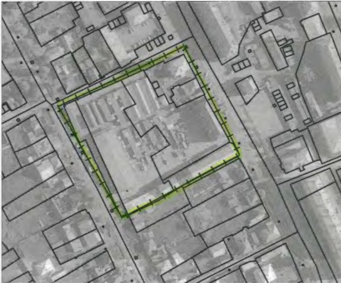
Схема границ прилегающих к объекту, расположенному по адресу: г.Боготол, ул.Интернациональная, д. 19, территорий на которых не допускается розничная продажа алкогольной продукции