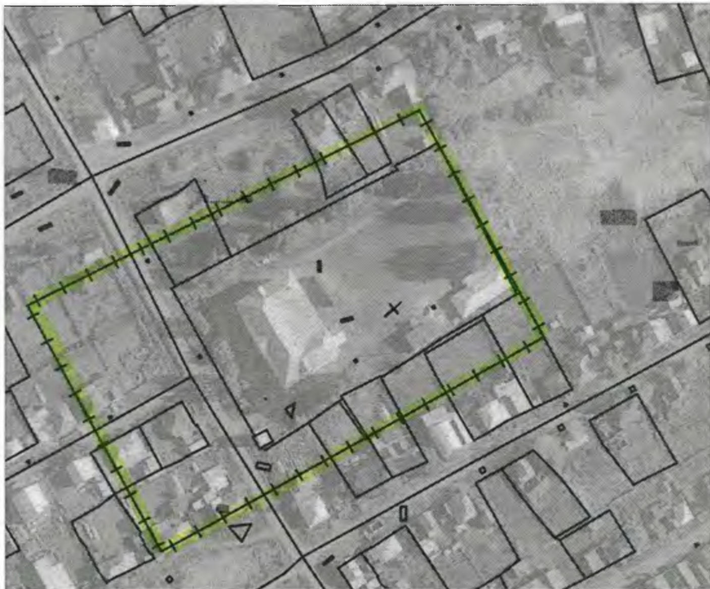
Схема границ прилегающих к объекту, расположенному по адресу: г.Боготол, ул. Урицкого, д. 8А, территорий на которых не допускается розничная продажа алкогольной продукции