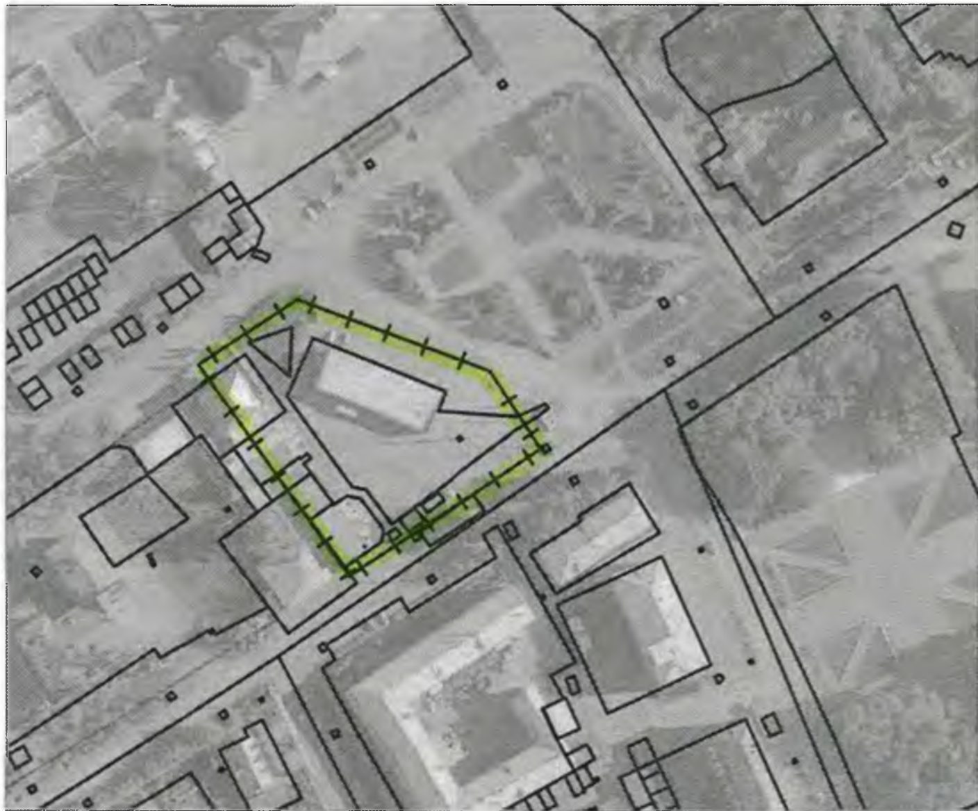
Схема границ прилегающих к объекту, расположенному по адресу: г.Боготол, ул.Кирова, д. 2А, территорий на которых не допускается розничная продажа алкогольной продукции