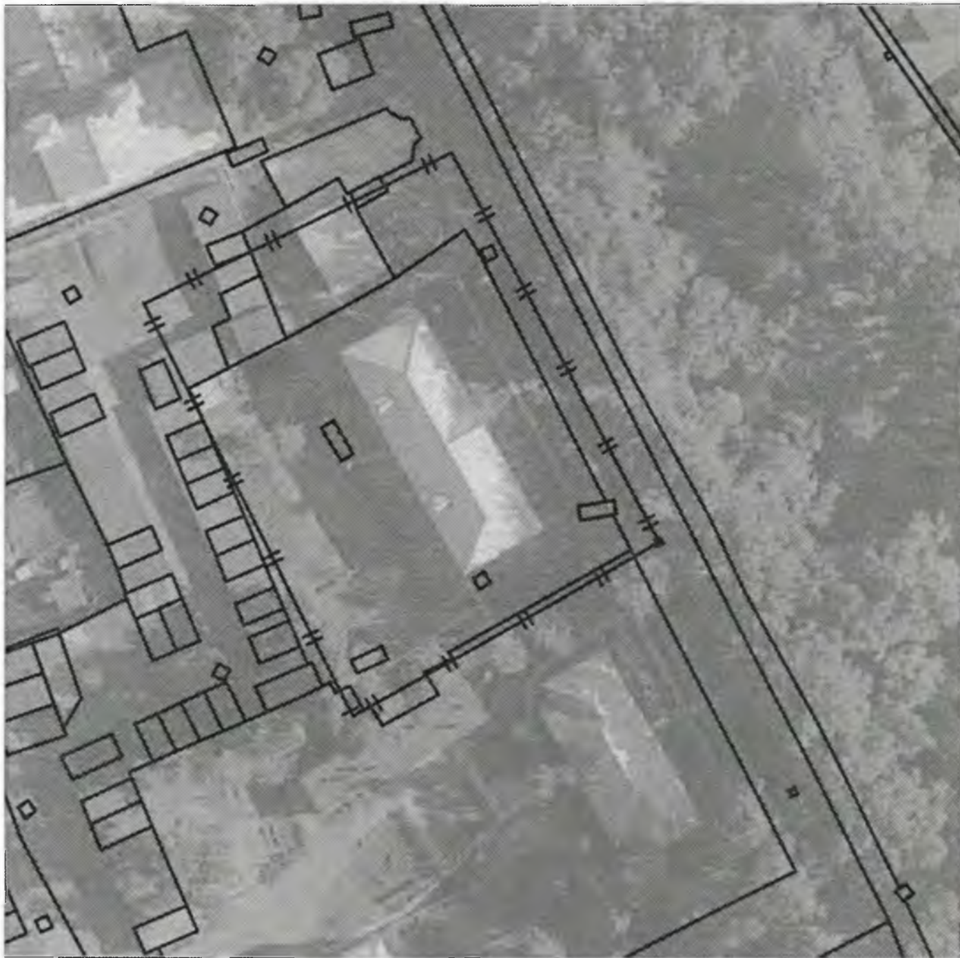
Схема границ прилегающих к объекту, расположенному по адресу: г.Боготол, ул. Комсомольская, д. 12, территорий, на которых запрещена розничная продажа алкогольной продукции