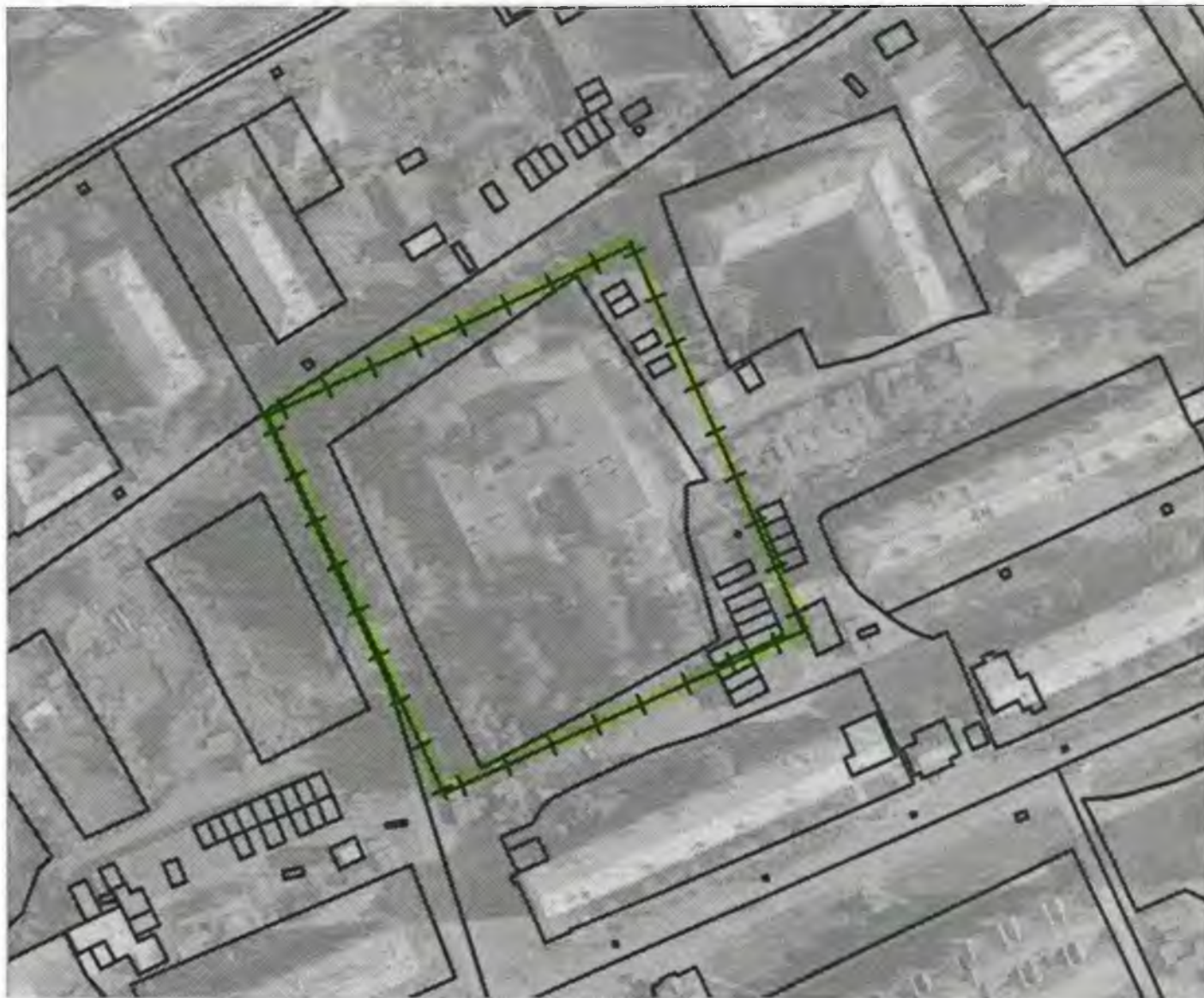
Схема границ прилегающих к объекту, расположенному по адресу: г.Боготол, ул. 40 лет октября, д. 27А, территорий на которых не допускается розничная продажа алкогольной продукции